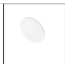
Lente per emissione ellittica M078700