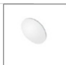
Filtro soft M078800