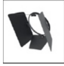
Alette orientabili M078600