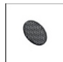
Griglia frangiluce M078400