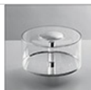
Optical unit 2x12° M057600