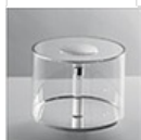
Optical unit 2x6° M057500