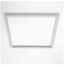
Recess frame for installation on plasterboard false ceiling. 625x625mm. M160602