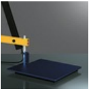
LOTEK TAVOLO BASE BLU 1737010A