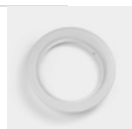
PARABOLA 175 CORNICE SHARP LIGHT ALL. NL7043002