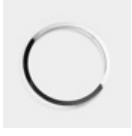
ANELLO CROMATO PARABOLA 175 NL31008