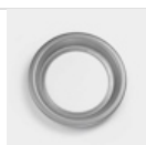
PARABOLA 175 CORNICE CURVED LIGHT BIA. NL7044006