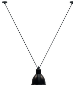
N°323 BL-SAT (SHADE ROUND XL)

Black satin steel | Colored or coppered shade Acier noir satin | Réflecteur couleur ou cuivré