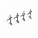
ALTOP FIXING BRACKETS (SET OF 4 PCS) M163520