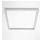
Recess frame for installation on plasterboard false ceiling. 625x625mm. M160602