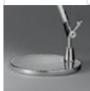
TOLOMEO LETT BASE ALL A014900