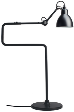
Table lamp | Lampe de table